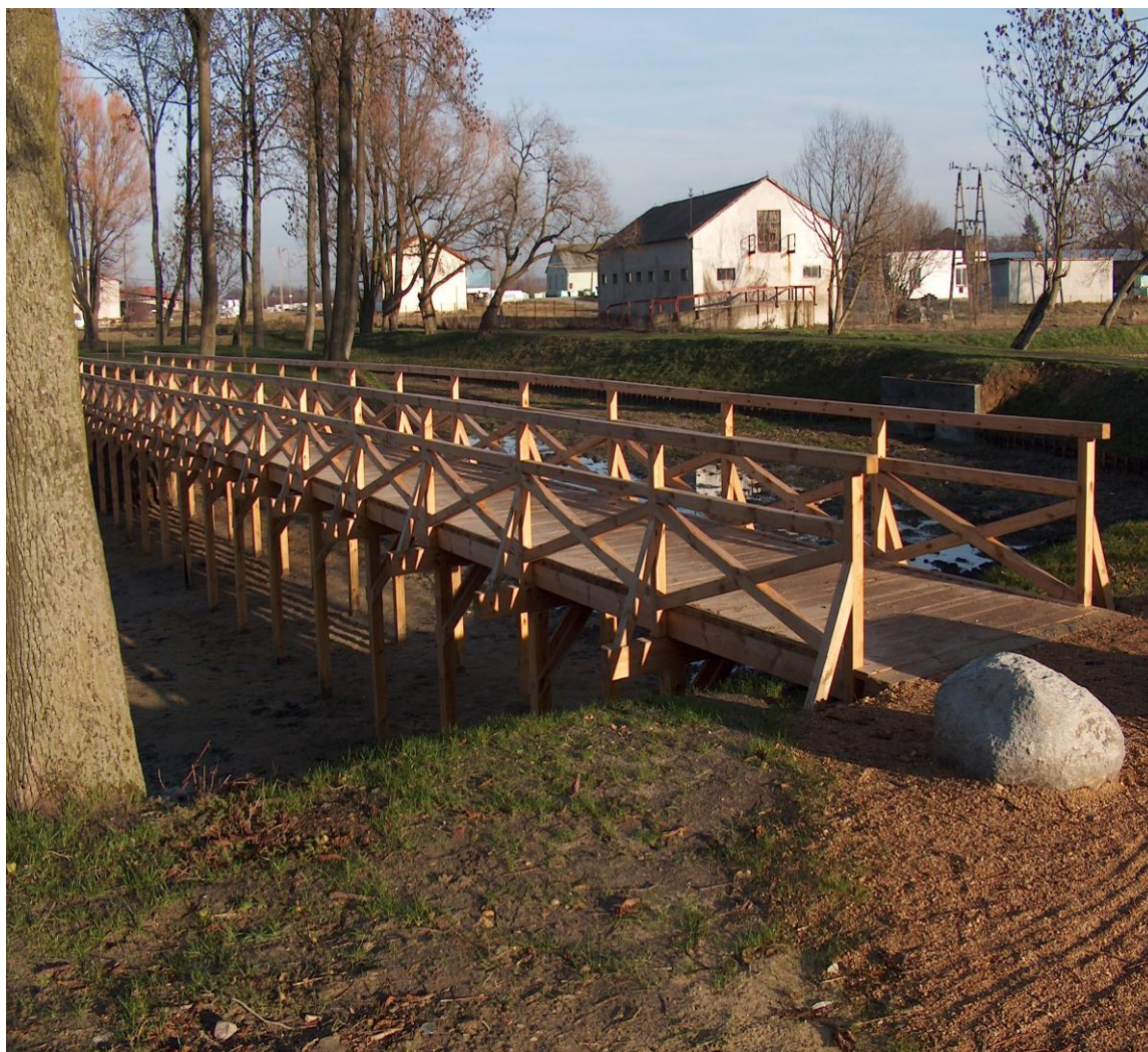
Zdj. Nr 1 Kładka prowadząca na wyspę w XIX wiecznym Parku Dworskim

W Mniszkowie, tak jak i na pozostałym obszarze gminy, obowiązuje ochrona przydrożnych kapliczek, krzyży i innych elementów małej architektury.