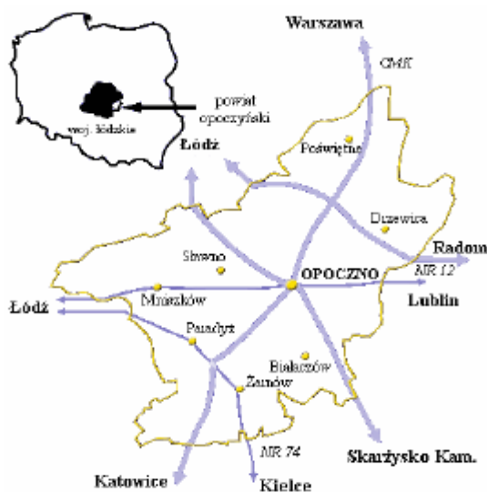
Rys. 1. Położenie powiatu opoczyńskiego