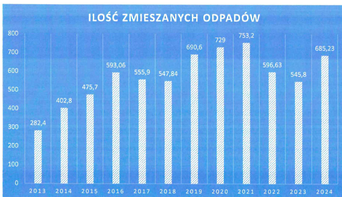
Wykres 2. Ilość zmieszanych odpadów odebranych z terenu Gminy Mniszków w latach 2013-2024