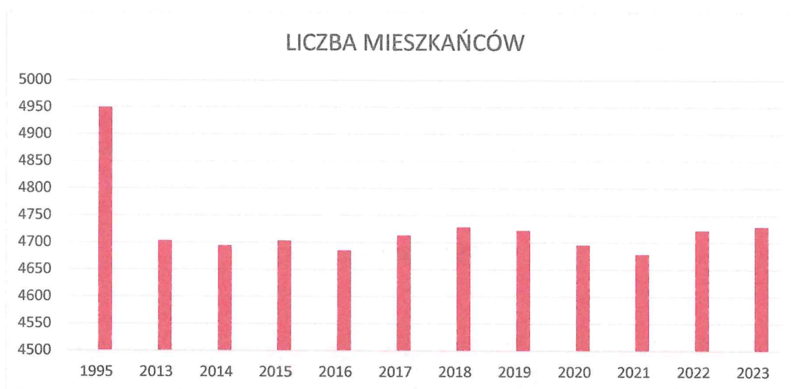
Wykres 1. Liczba mieszkańców Gminy Mniszków

Powyższy wykres przedstawia liczbę mieszkańców gminy w ostatnich latach w porównaniu do roku 1995.